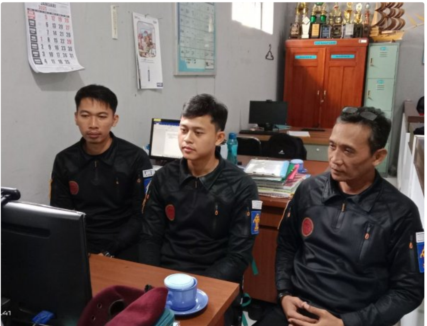
Bangun Harmoni dan Strategi, Lapas Besi Ikuti Webinar Refleksi Akhir Tahun 2024 & Resolusi 2025

CILACAP – Sebagai salah satu langkah dalam pengembangan kompetensi bagi Aparatur Sipil Negara (ASN), Petugas Lembaga Pemasyarakatan Kelas IIA Besi berpartisipasi dalam kegiatan webinar bertajuk "Refleksi Akhir Tahun 2024 dan